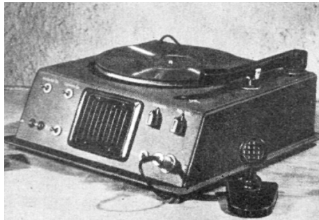
Bild 2. Dimaton-Diktiermaschine der Fa. Abmann

Die Mende-Leute, die früher ihre Lautsprecher hauptsächlich von Isophon bezogen und die mit ihrer Nachkriegs-Produktion an Lautsprechern selbst nicht zufrieden waren, haben große Mittel in die Lautsprecher-entwicklung hineingesteckt und ein Modell geschaffen, das in einem neuen Spitzensuper eine beachtliche Ton-