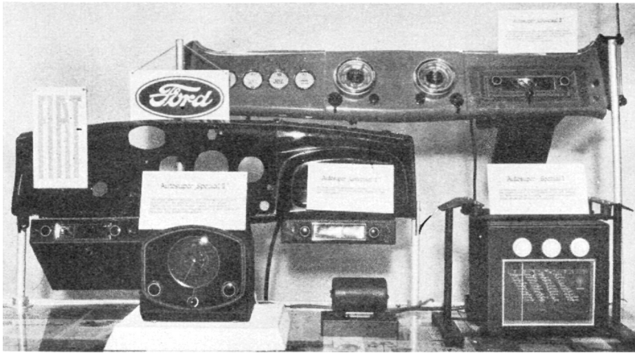
Bild 4. Auto-Super-Schau der Fa. Seibt