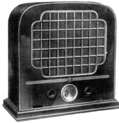
Das ruhige, stilvolle Äußere des Tel. 33 paßt sich jedem Wohnräume ausgezeichnet an.

gen Druck überwinden läßt; dadurch schnappt eine Schaltvorrichtung ein, die nun den Gitterkreis des Audions unmittelbar in die Antennenleitung bringt und somit am festesten mit ihr koppelt. Hierauf ist besonders aufmerksam zu machen, weil man erstens Bedenken haben könnte, das Hebelchen so kräftig nach oben zu drücken, und weil man auch gemeinhin nicht erwartet, daß die bei der Bewegung des Hebelchens nach oben hin. abnehmende Kopplung schließlich gerade hier in der festesten Kopplung endet. Schwierigkeiten entstehen aus dieser Anordnung aber nicht, weil man nämlich das Hebelchen beim Empfang des Orts- oder Bezirksenders, wobei keine besonders hohe Selektivität erforderlich ist, immer in der obersten Stellung festschnappen, dagegen beim Fernempfang stets lösen wird, um seine für die gewünschte Trennschärfe günstigste Stellung zu suchen.